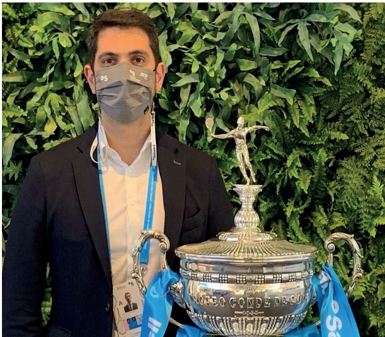
Una de las grandes oportunidades como director de Eventos Corporativos de Banco Sabadell es la organización de la activación del patrocinio del Barcelona Open Bank Sabadell Trofeo Conde de Godó.

“De esta profesión me apasiona especialmente contribuir a desarrollar e implementar estrategias, hacer que las “cosas” pasen, a conectar intereses y personas, comunicar y generar actividad constante para seguir avanzando”